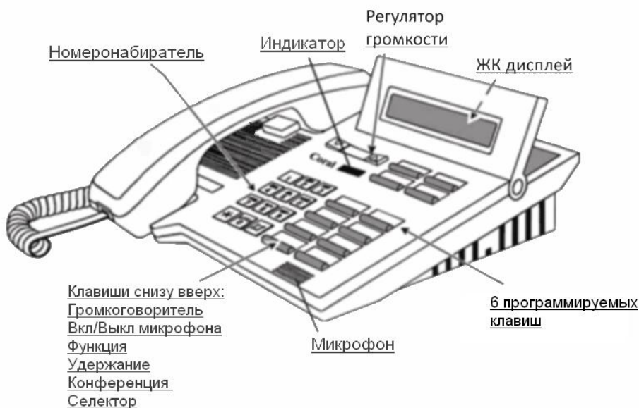
Рисунок 2 – Расположение элементов управления системного телефонного аппарата серии DKT1110